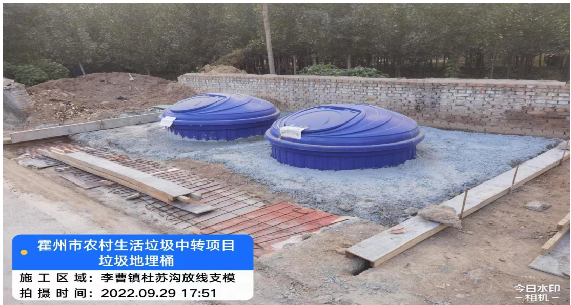
● 霍州市农村生活垃圾中转项目 垃圾地埋桶 施工区域：李曹镇杜苏沟放线支模 拍摄时间：2022.09.29 17:51