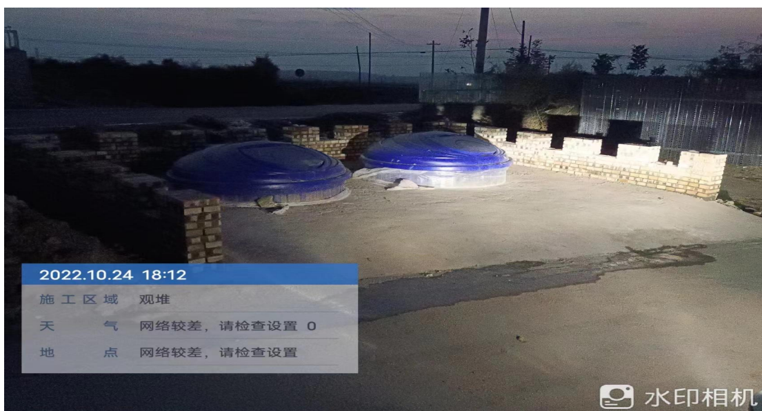
2022.10.24 18:12 施工区域 观堆 天气 网络较差, 请检查设置 0 地点 网络较差, 请检查设置