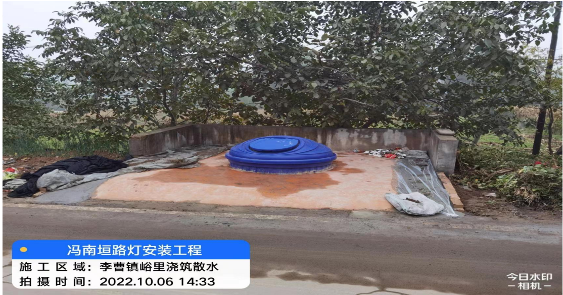
● 冯南垣路灯安装工程 施工区域：李曹镇峪里浇筑散水 拍摄时间：2022.10.06 14:33